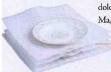
FOGLI SCHIUMA per imballare i piatti (Belinlen su » amazon.it, cm 30,5x30,5 €15,44/75 pz).