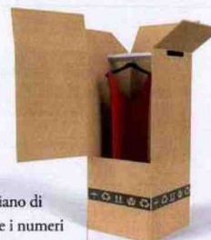
SCATOLA PORTA-ABITI attrezzata con barre appendiabiti all'interno. In cartone doppia onda 100% riciclato, molto resistente. Contiene fino a 35 capi [Imballaggi 2000 su » amazon.it €26 la conf. da 2 pezzi con nastro adesivo in omaggio].