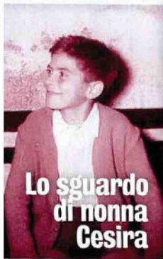
Lo sguardo di nonna Cesira