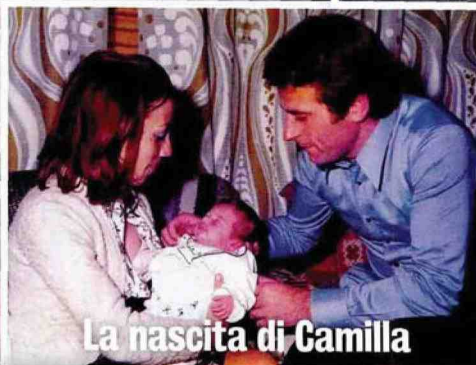
La nascita di Camilla